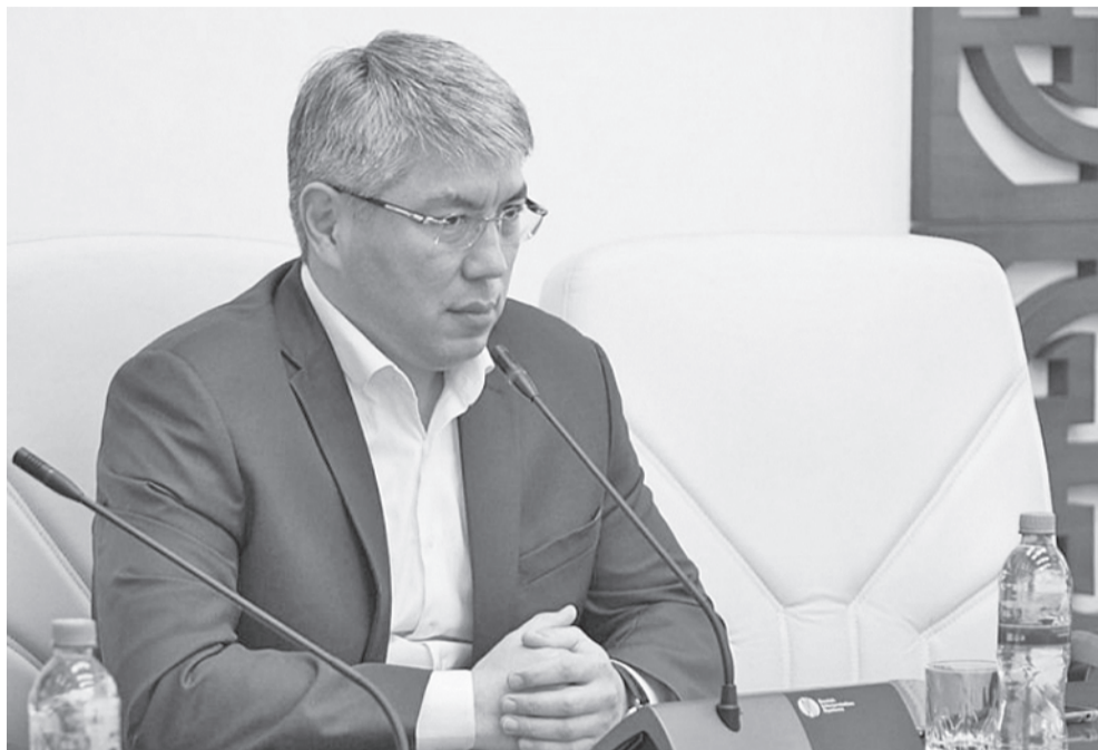
Глава Бурятии рассказал о предистории конфликта Запада с Россией

Накануне глава Бурятии Алексей Цыденов подробно высказался о последних событиях на Украине и вокруг нее, а также сделал экскурс в историю, почему Россия в итоге признала Донецкую и Луганскую народные республики и была вынуждена начать специальную военную операцию. Произошло это на ранее запланированной встрече с представителями бизнеса, организованной Торгово-промышленной палатой РБ. После выступления главы встреча прошла по утвержденной ранее повестке.